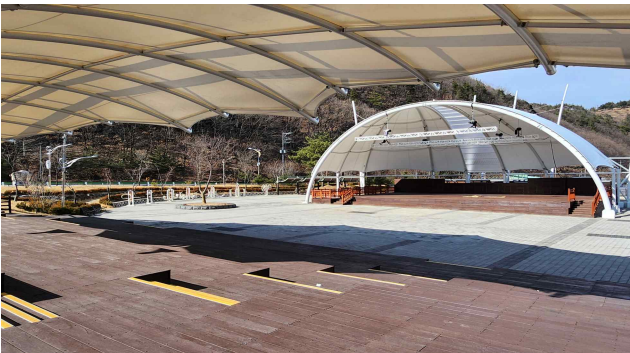
도계 장터 야외무대