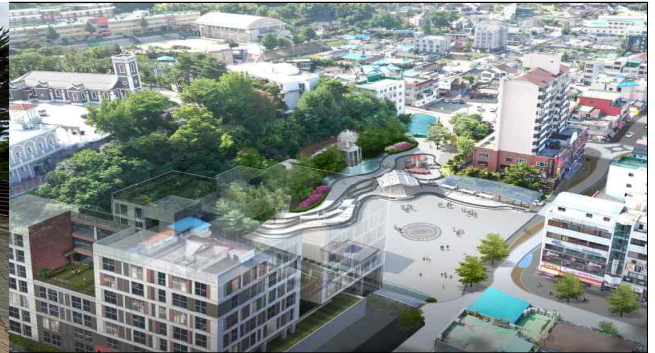
대학로 문화공원(4월 준공예정)