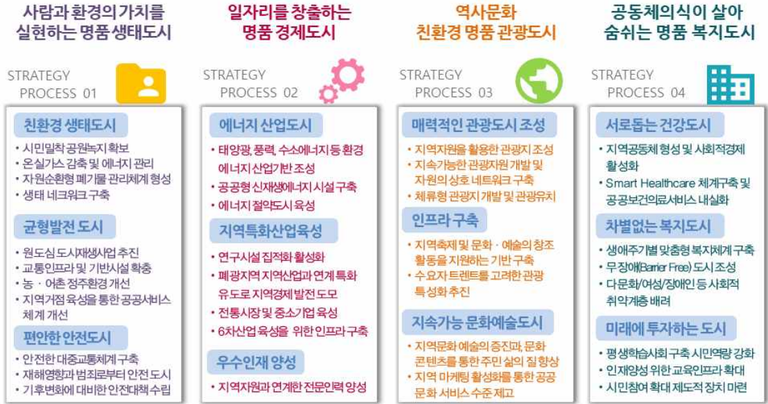
[표] 계획목표별 추진전략