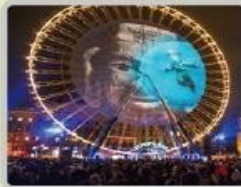
리옹 빛 축제