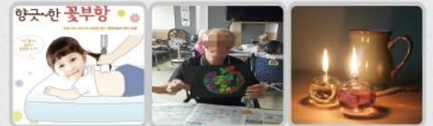
꽃부항 글라스 아트테라피 아로마램프(유리공예)