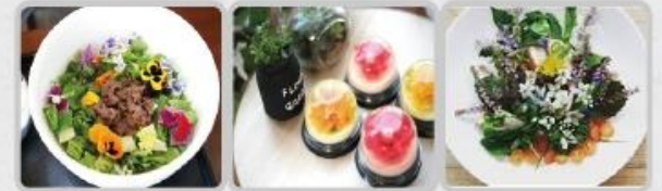
꽃+산채 비빔밥 야생화 젤리 꽃 샐러드