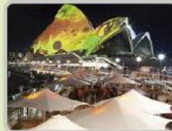
시드니 빛 축제