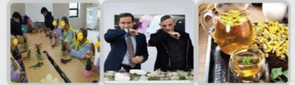
플라워테라피 향기테라피 꽃차테라피