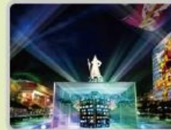
서울 빛 축제