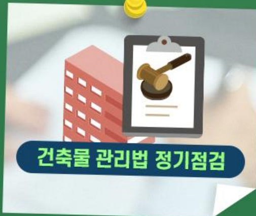
건축물 관리법 정기점검