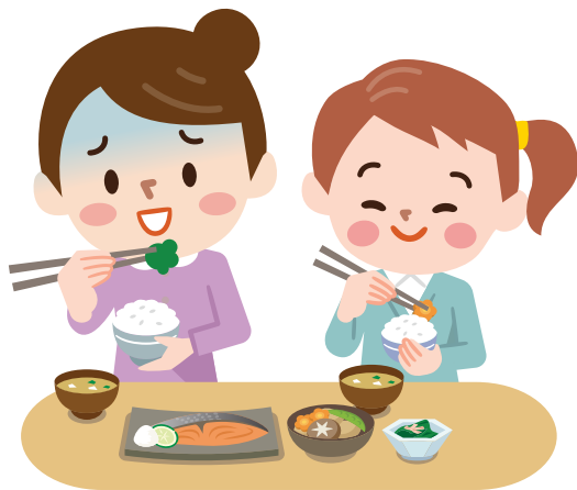
감염자와 함께 식사