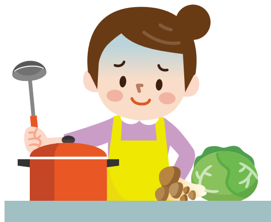
감염자가 만든 음식