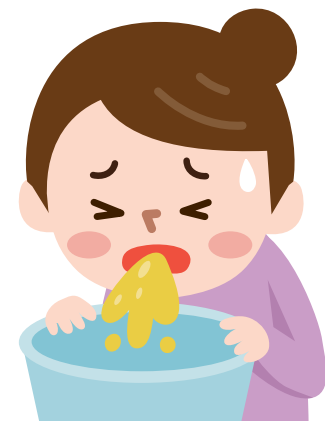
감염자의 분변이나 구토물