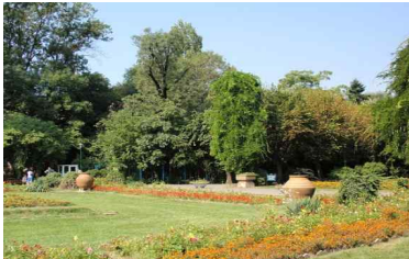
루마니아 광산 가드닝

공연무대가 갖춰진 전국 5개 매장에서 문화예술인재 후원을 위한 특별 공연 개최 및 고객 참여형 럭키드로우 이벤트 진행