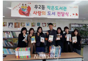
부산 해운대구 우2동 새마을 문고

The Village of Dognecea는 루마니아 남서부에 광산 지역의 변화를 위해 지역주민과 광산인부와 함께 나무를 심고 캠핑 하이킹 숲해설 등의 자원봉사를 함