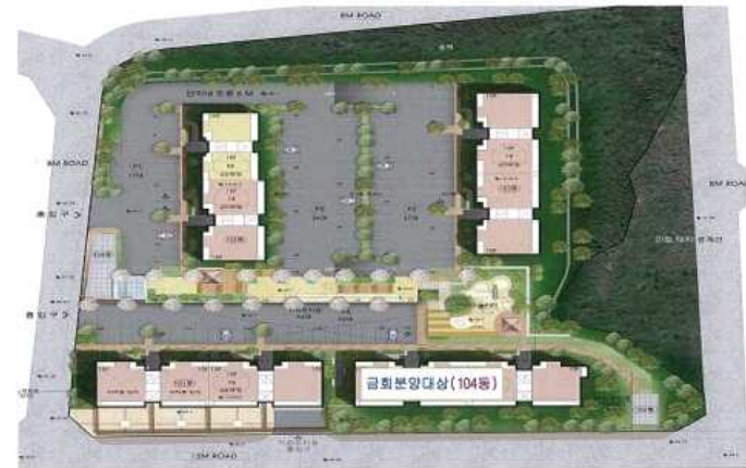
층 200세대 55형 20세대 78형 180세대 (금회 60세대 분양)