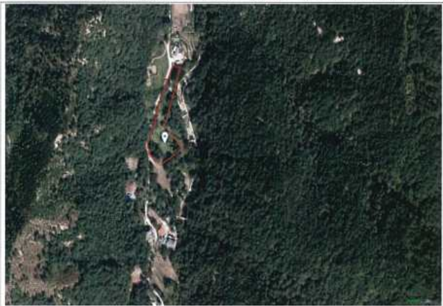
○ 위치도(항공사진)(삼척시 근덕면 용화리 479-5번지/ 3,502㎡)