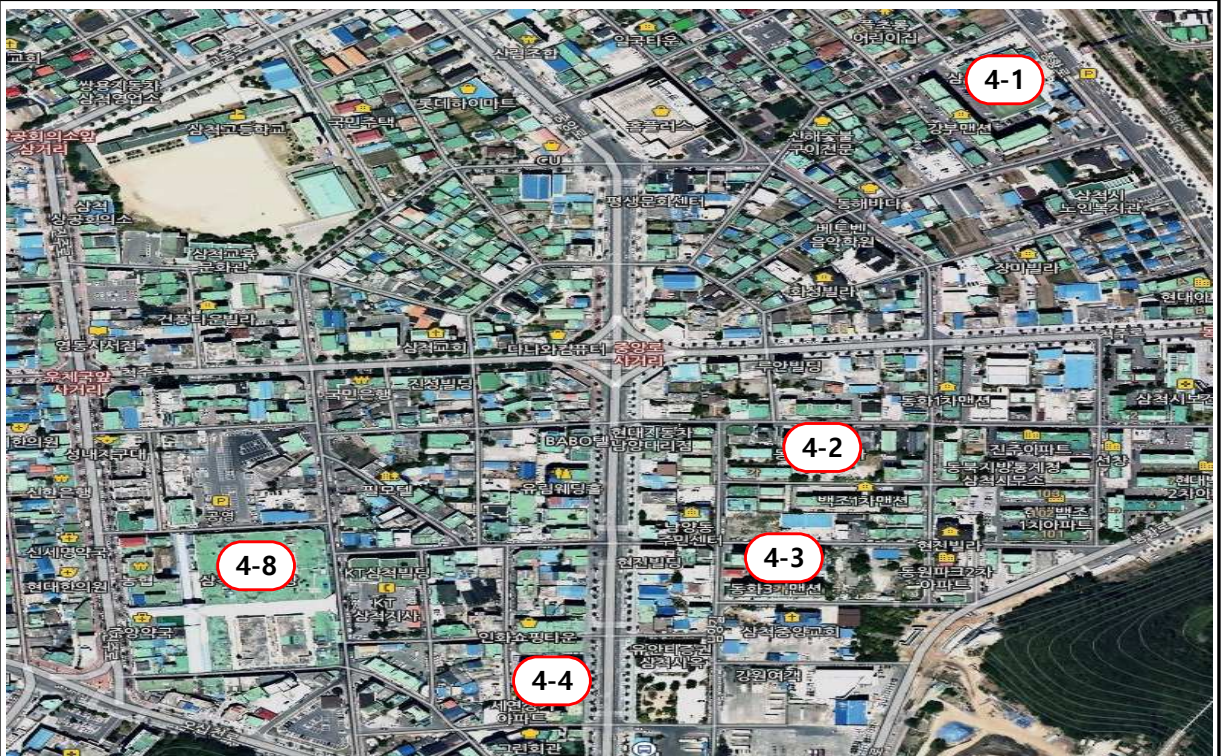
4-1 삼척소방서, 4-2 남양동 동원파크3차, 4-3 남양동 동화3차아파트, 4-4 세연상가, 4-8 삼척중앙시장