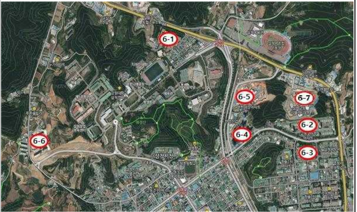
6-1 교동 동부아파트, 6-2 교동 코아루아파트, 6-3 교동 신동아아파트 6-4 코아루타워아파트, 6-5 e편한세상아파트, 6-6 세영리첼아파트, 6-7 지웰아파트