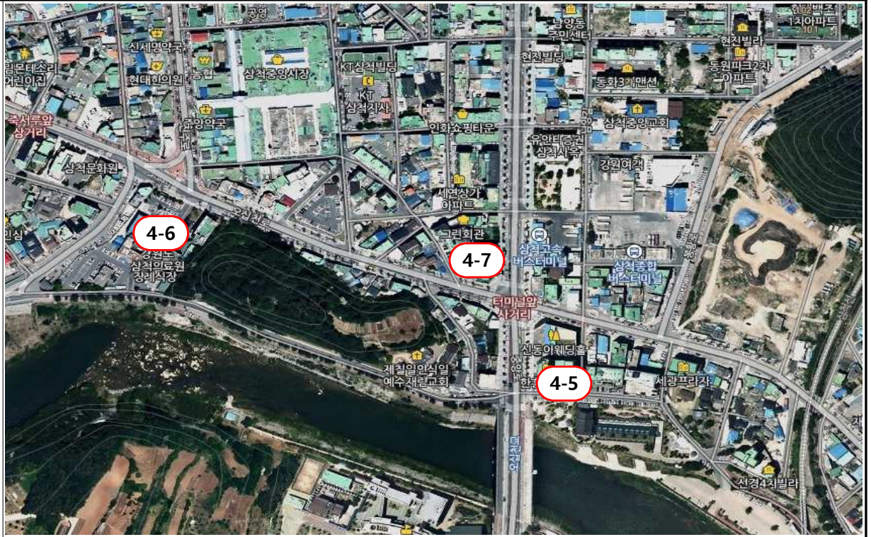
4-5 한흥프라자, 4-6 삼척의료원, 4-7 삼원상가