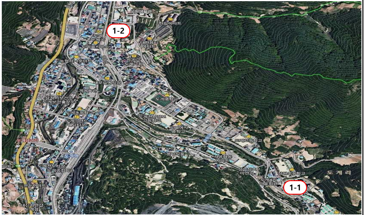
1-1 도계내단지아파트, 1-2 도계새롬아파트