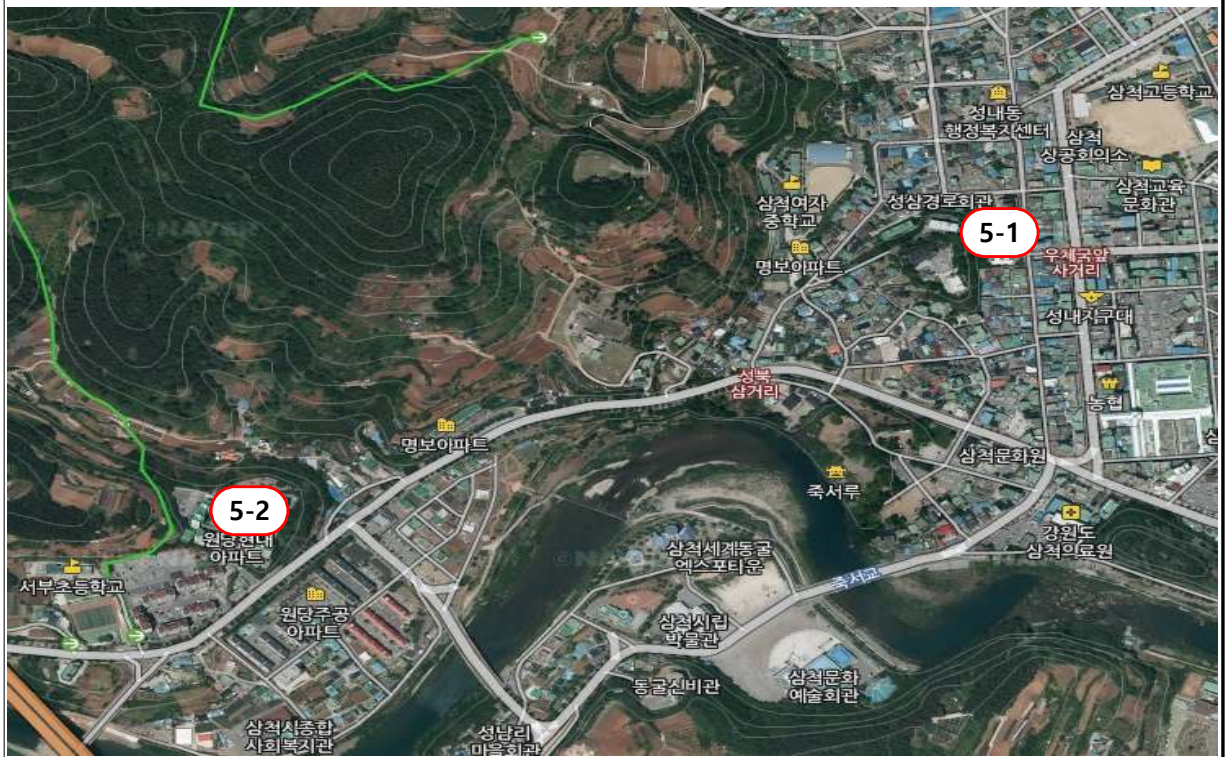
5-1 대학로 지하주차장, 5-2 원당동 현대아파트